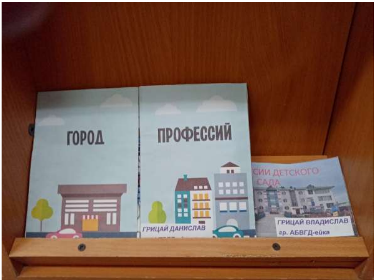
Лэпбук «Город профессий»